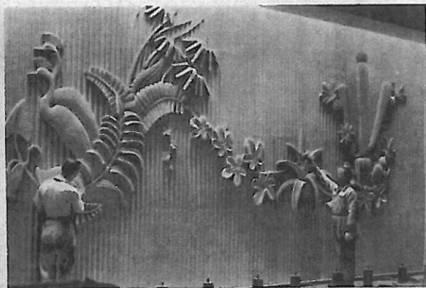
Herover: I Forhallen er Væggene udsmykkede med skønne Ornamenter i Sandsten.