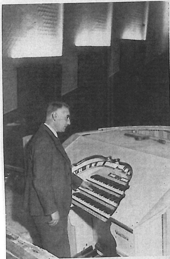
Danmarks første Kinoorgel staar i den nye Palladiumbiograf. Det afprøves her af Europa-Direktøren fra det store amerikanske Kinoorgelfirma. Han ser ud til at være godt tilfreds med Akustiken.